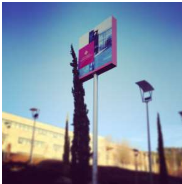
Fig. 1. Campus de Cuenca . José A. Perona. 2015

Todas las figuras y tablas se colocarán en un lugar próximo al que se citen por primera vez. Se colocará un pie Fig. seguido del número debajo de cada imagen o fotografía y un pie. Todas las fotografías deben tener una resolución de 300 puntos por pulgada.